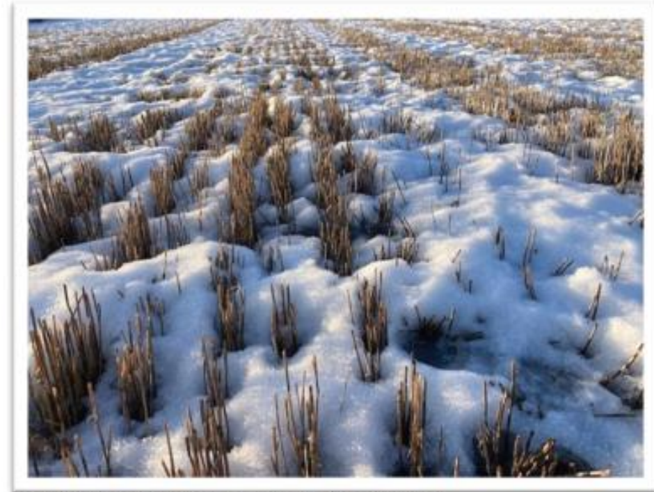
åker i stubb, Nome kommune