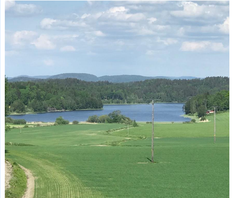
Goksjø