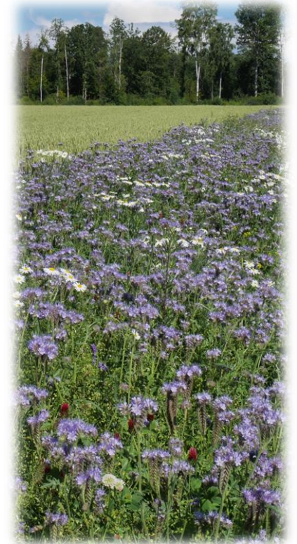
Standard pollinatorblanding med importert frø